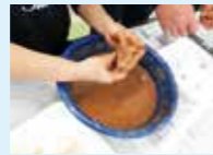
10月18日(日) 土で染めよう