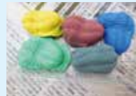
10月4日(日) 化石のレプリカ