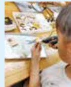
9月27日(日) 貝がら工作