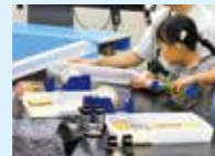
7月26日(日) 空気ロケット